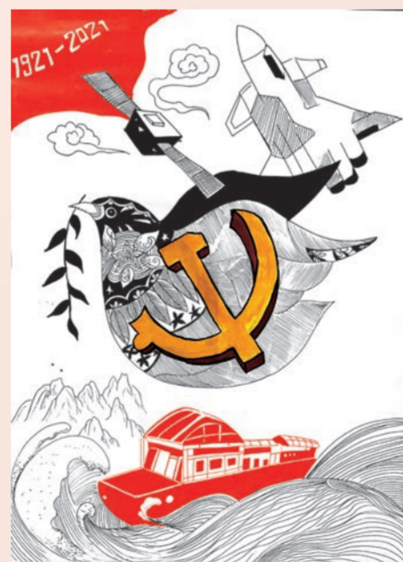
▲ 19级汽车运用与维修班 郝亚楠