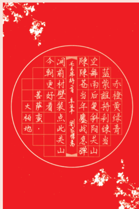
▲ 20级机电一体化班 刘家胜

我们生在红旗下，长在春风里，人民有信仰，国家有力量，民族有希望。目光所至皆为华夏，五星闪耀皆为信仰，让我们一心向党，紧跟党的步伐，启航新的征程。