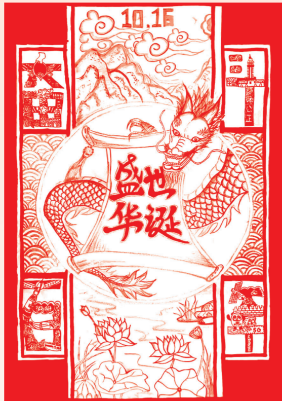
▲ 2019级烹调工艺与营养五年制 刘如玉