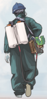
▲ 2020级机电一体化7班 辛奇航